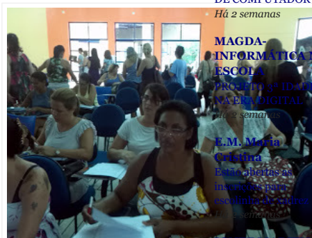
MAGDA - INFORMÁTICA NA ESCOLA PROJETO 3ª IDADE PALESTRA DIGITAL Há 2 semanas