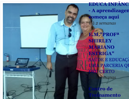
ITANHAÉM EDUCAÇÃO INFÂNCIA - A aprendizagem começa aqui Há 2 semanas